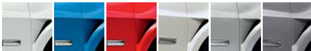
LEDENO BIJELA (OV 369) PLAVA SPORT (OV J45) CRVENA TORO (OV NNF) BIJELA GIVRE NACRE (TE QND) ALU SIVA (TE D69) SIVA ASPHALTE (OV KNQ)