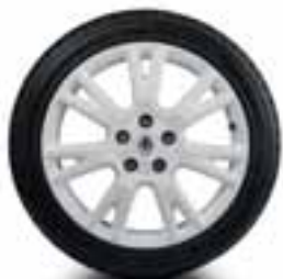
NAPLATAK CUP BIJELE