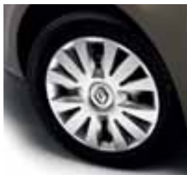
UKRASNI POKROV FAR AWAY 15"