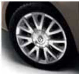
NAPLATAK CANASTA MÉTALLIQUE 16"