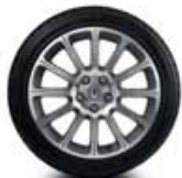
NAPLATAK BEBOP S DIJAMANTNIM SJAJEM