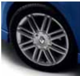
NAPLATAK DARK METALLIC (GT) 16"