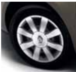
UKRASNI POKROV TARANIS 15"