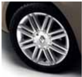
NAPLATAK SOLONIA 16"