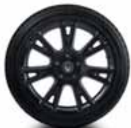
NAPLATAK CUP CRNA