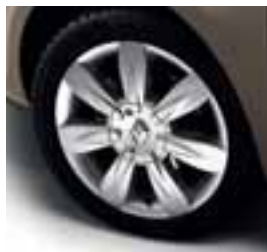
NAPLATAK LYRIA 16"