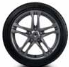
NAPLATAK AX-L METALNO SIVA