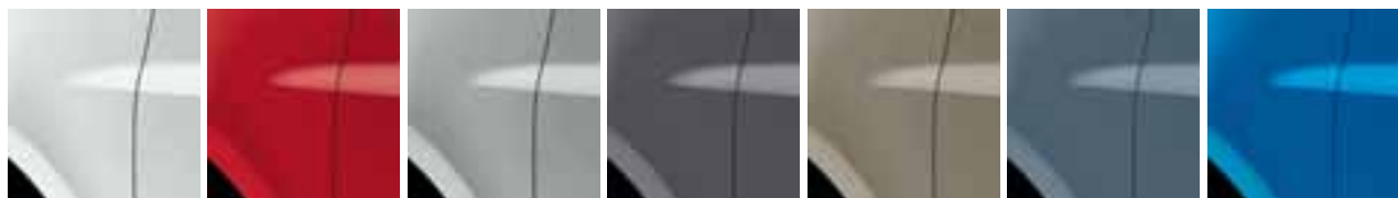
LEDENO BIJELA (OV 369) ŽARKO CRVENA (OV 727) ALU SIVA (TE D69) SIVA CASSIOPÉE (TE KNG) BEŽ CENDRÉ (TE HNK) PLAVA GRIS (TE J47) PLAVA EXTRÊME (TE RNA)