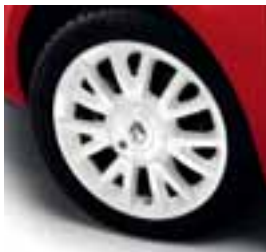
NAPLATAK CANASTA BIJELE BOJE 16"