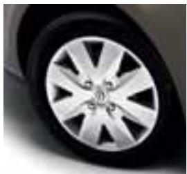
UKRASNI POKROV DERMIC 15"