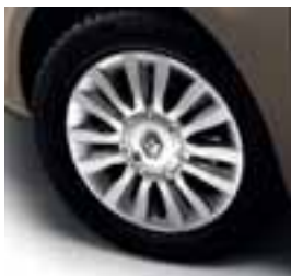
NAPLATAK DEL ARTE 15"