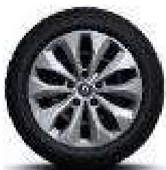
Čelični naplatci 16" s ukrasnim pokrovima kotača Florida

S = Serija O = Opcija - = Nije dostupno P = Paket