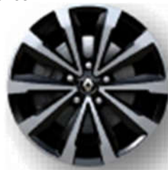
Aluminijski naplatci 17" Monthlery