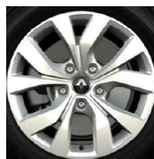
Aluminijski naplatci 16" Celsius Silver