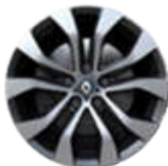
Aluminijski naplatci 17" Allium