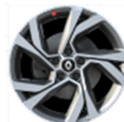
Aluminijski naplatci 18" Magny Cours