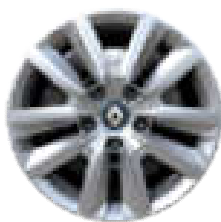
Ukrasni pokrovi kotača Flexwheel 16"