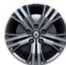
Aluminijski naplatci 16" Siva Impulse