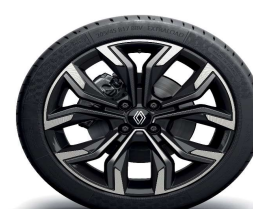
Aluminijski naplatci 17" Monastella