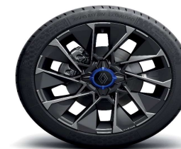
Aluminijski naplatci 17" La Fleche