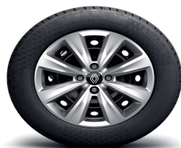
Ukrasni pokrovi kotača 15" Iremia

(1) Obavezno osim pri odabiru boja karoserije TEEQB i TENNP