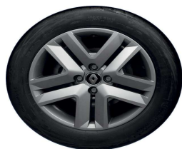
Ukrasni pokrovi kotača 16" Amicitia