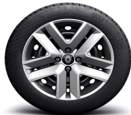
Ukrasni pokrovi kotača 16" Amicitia