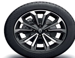
Aluminijski naplatci 16" Boa Vista crne boje