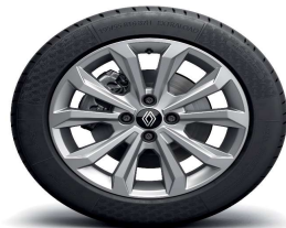
Aluminijski naplatci 16" Boa Vista