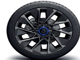
Aluminijski naplatci 17" La Fleche