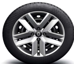
Ukrasne ratkape 16" Amicitia