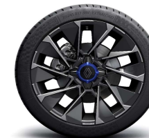
Aluminijske felge 17" La Fleche