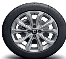
Aluminijske felge 16" Boa Vista