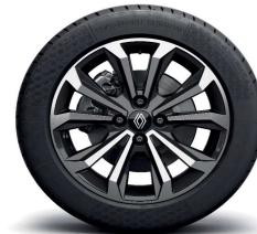
alumijske felge 16" Boa Vista crne boje