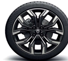
alumijske felge 17" Monastella