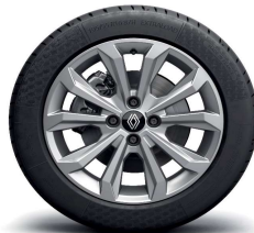
alumijske felge 16" Boa Vista