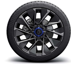
alumijske felge 17" La Fleche