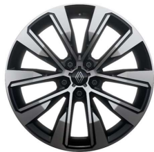
19" alu naplatci Komah

S = Serija O = Opcija P = V paketu - = Nije dostupno