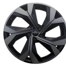
20" alu naplatci Daytona