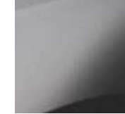
siva schiste mat