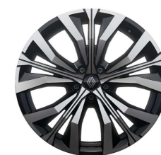
20" alu naplatci Effie