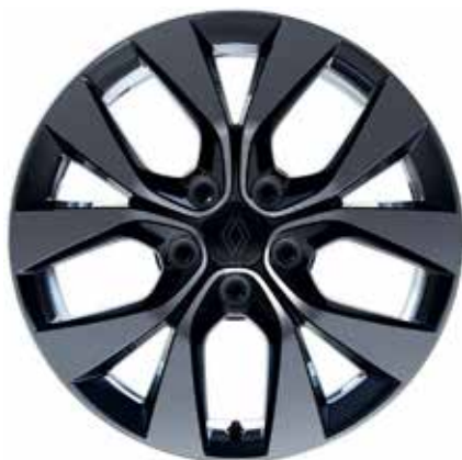
alumijski naplatci 17" Eridis