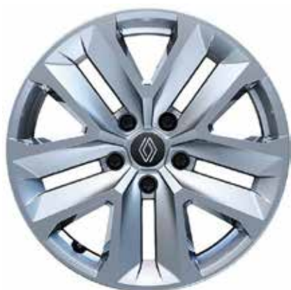
ukrasni pokrovi kotača 17" Nymphaea