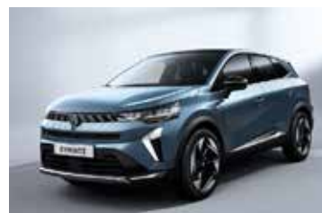
plava Mercure (2),(3)