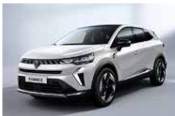
biserno bijela (2)