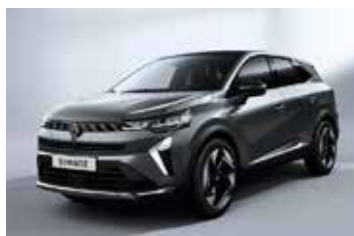
siva Cassiopee (2)