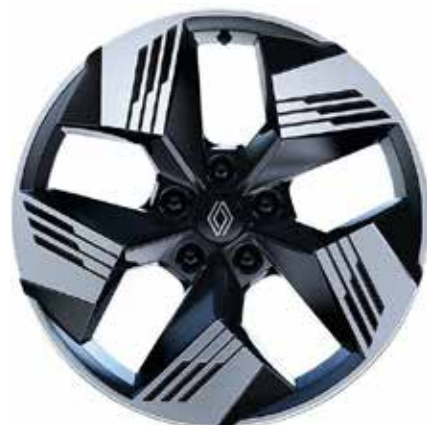
alumijski naplatci 18" Gravity