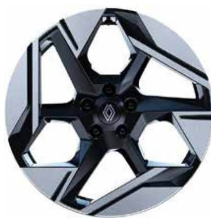
alumijski naplatci 19" Pulsar