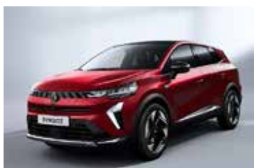
crvena Flamme (2)