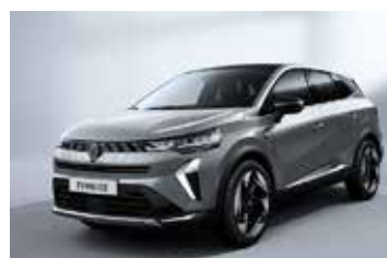
siva Rafale (1)