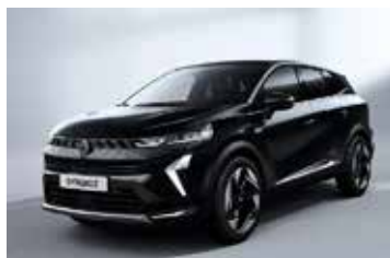
crna Etoile (2)