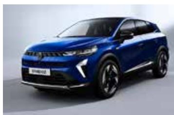
plava Iron (2)