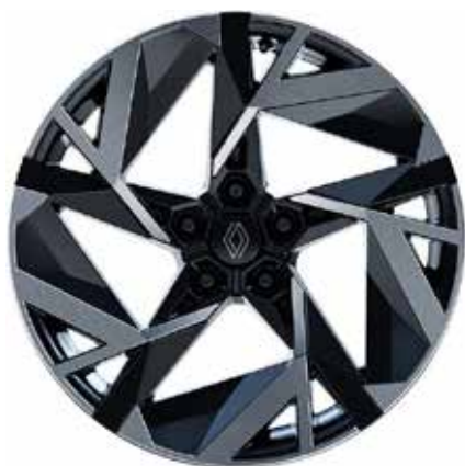
alumijski naplatci 19" Elixir