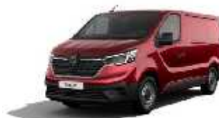
Crvena Carmin (2)