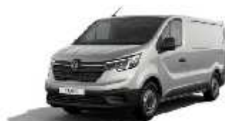
Siva Highland (2)