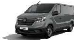
Siva Urban (1)