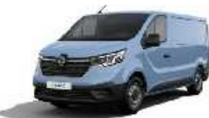
Cumulus plava (1)