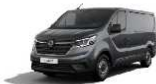
Siva Comete (2)