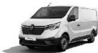
Mineralno bijela (1)