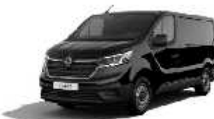
Crna Midnight (2)