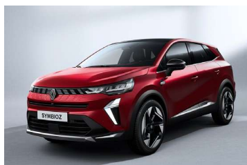
crvena Flamme (2)