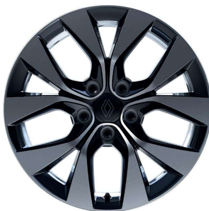
alumijski naplatci 17" Eridis