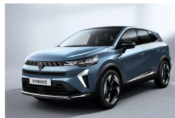
plava Mercure (2),(3)