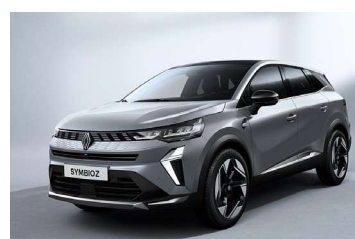
siva Rafale (1)