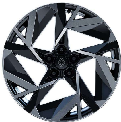
alumijski naplatci 19" Elixir