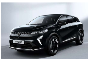
crna Etoile (2)