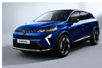
plava Iron (2)