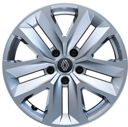
ukrasni pokrovi kotača 17" Nymphaea