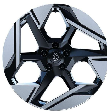
alumijski naplatci 19" Pulsar