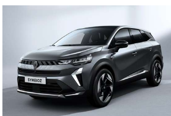
siva Cassiopee (2)