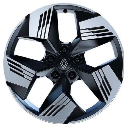
alumijski naplatci 18" Gravity