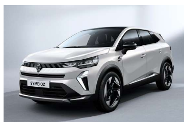
biserno bijela (2)