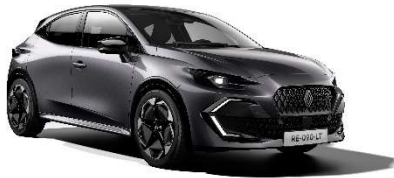
siva Schiste (2)