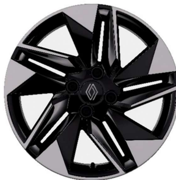
41-cm (16") aluminijski naplatci Dynamo