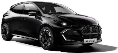
biserno crna (2)