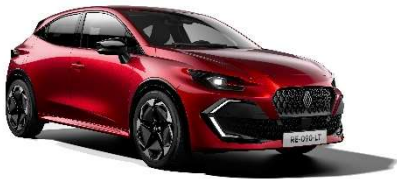
crvena Absolute (2)