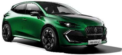
zelena Absolute (2)