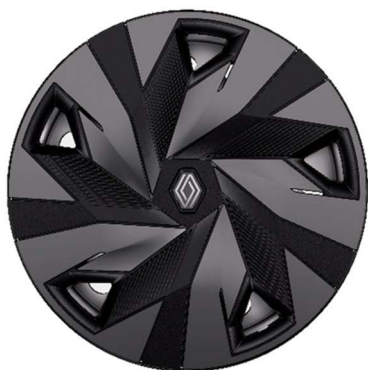
čelični poklopci 41 cm (16") Synchro