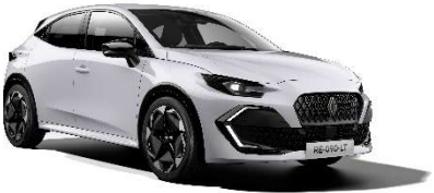
ledeno bijela (1)