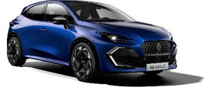
plava Iron (2)