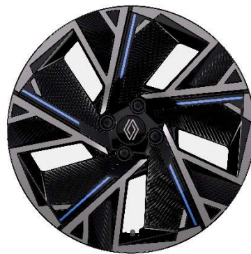
46-cm (18") aluminijski naplatci Cosmic