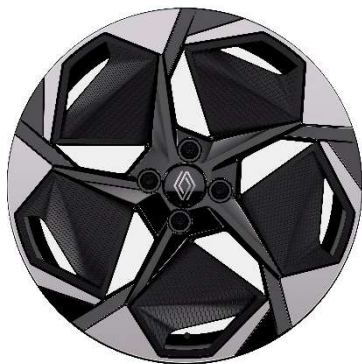
46-cm (18") aluminijski naplatci Rythmic