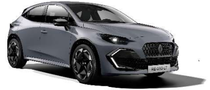
siva Rafale (2)