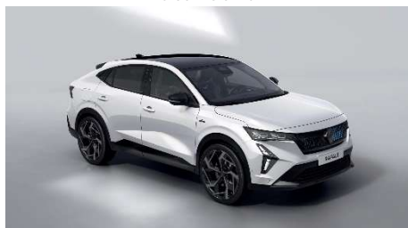
perla bijela s biserno crnim krovom (1)