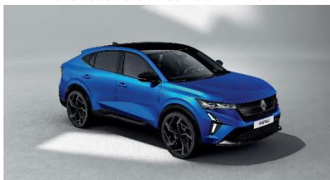
plava Alpine s biserno crnim krovom (3)