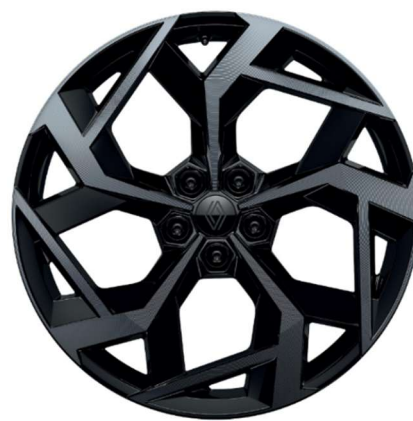
21" alu naplatci Chicane