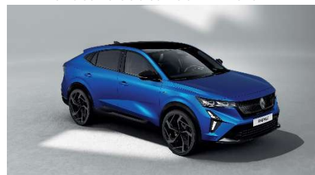
mat plava Alpine s biserno crnim krovom (2)