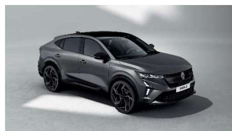
siva schiste s biserno crnim krovom (1)