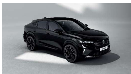
biserno crna (1)