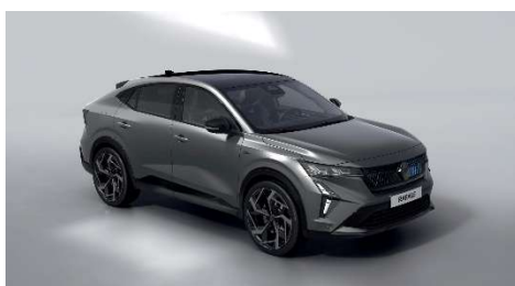
mat siva schiste s biserno crnim krovom (2)