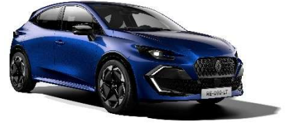
plava Iron (2)