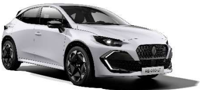
ledeno bijela (1)