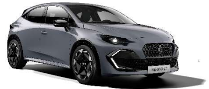
siva Rafale (2)