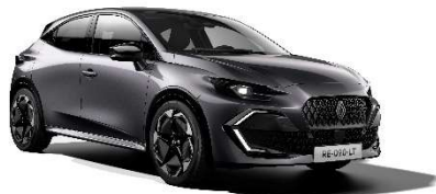
siva Schiste (2)