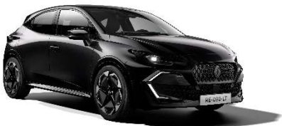
biserno crna (2)