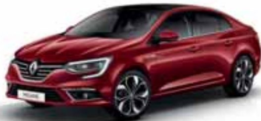
Crvena Intens (MB-P)