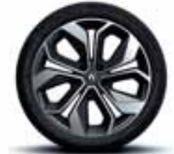
Aluminijski naplatci 18" Grandtour (Opcijski naplatci)