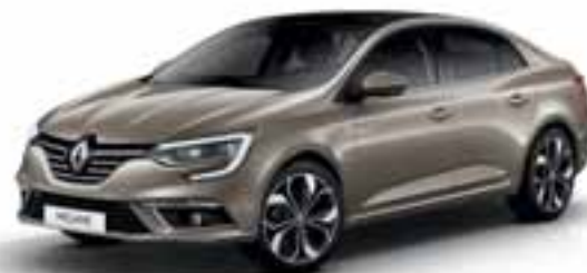
Bež Dune (MB)