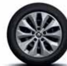
Čelični naplatci 16" s ukrasnim pokrovima kotača Florida