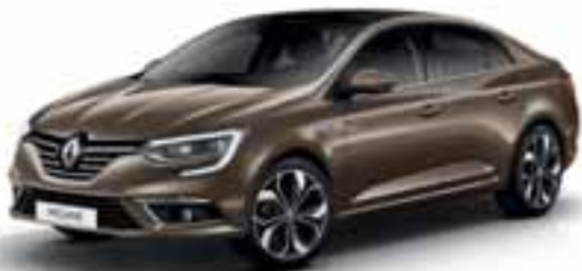
Smeđa Vison (MB)