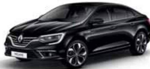
Crna Etoile (MB)