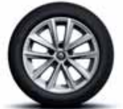
Aluminijski naplatci 16" Silverline (Opcijski naplatci)