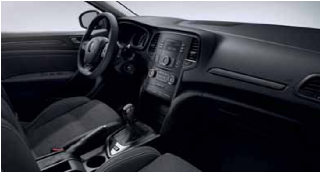
Slika je simbolična.