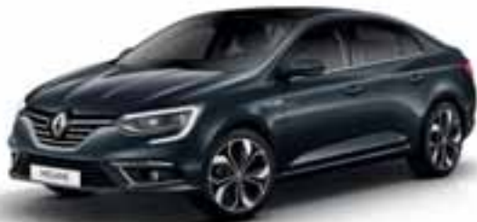
Siva Titanium (MB)