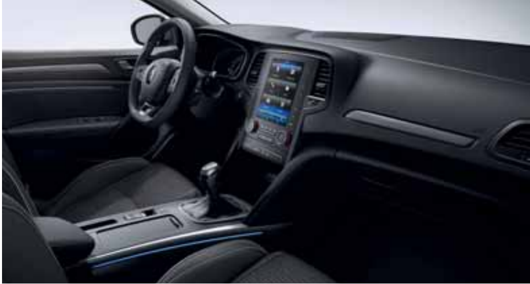
Slika prikazuje opcijsku opremu.