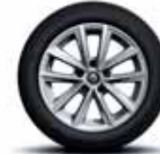
Aluminijski naplatci 16" Silverline