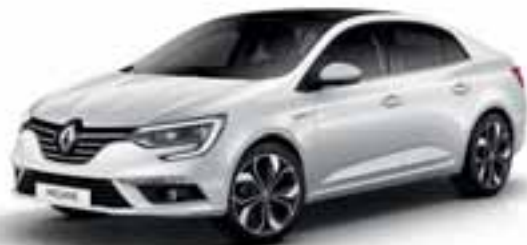
Perla bijela (MB-P)