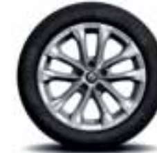
Aluminijski naplatci 17" Exception (Opcijski naplatci)