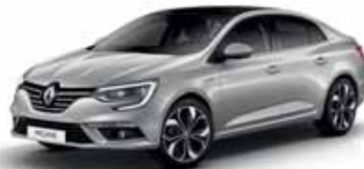
Alu Siva (MB)