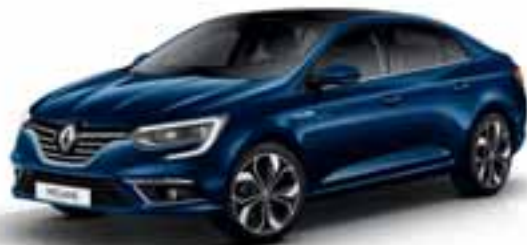
Plava Cosmos (MB)