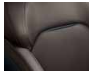
Presvlake od smeđe tkanine u kombinaciji s imitacijom kože*