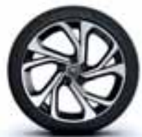
Aluminijski naplatci 20" Quartz