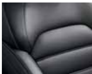
Crne kožne presvlake*