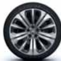
Čelični naplatci 20" s ukrasnim pokrovima Vortex