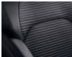
Presvlake od tamnosive tkanine