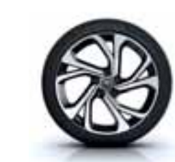
Aluminijски naplatci 20" Quartz