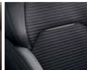
Presvlake od tamnosive tkanine u kombinaciji s imitacijom kože