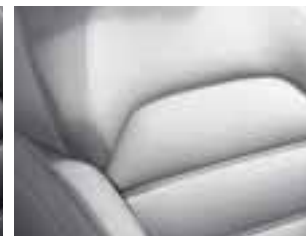
Presvlake od svjetlosive kože*