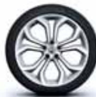
Aluminijski naplatci 20" Silverstone