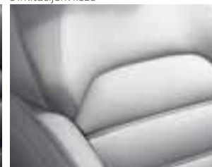
Presvlake od svjetlosive kože*