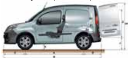
Kangoo Express Compact

VISINA, ŠIRINA, OBUJAM PRTLJAŽNIKA... FURGON PO MJERI KOJI ZADOVOLJAVA SVE VAŠE POTREBE.